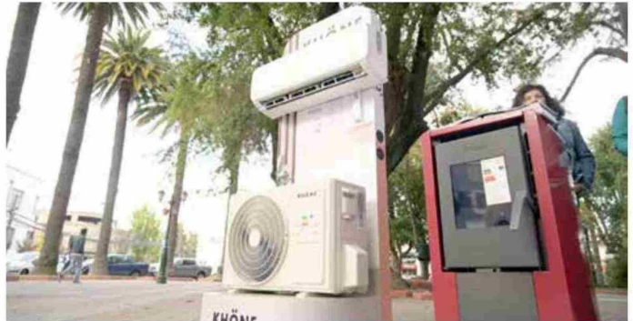
Los postulantes pueden revisar las Actas de Seleccionados para saber si fueron seleccionados.