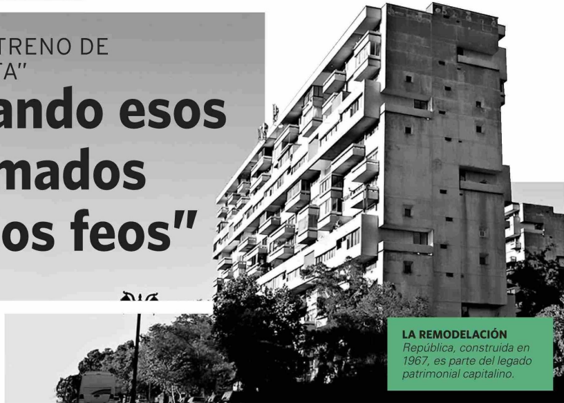
LA REMODELACIÓN República, construida en 1967, es parte del legado patrimonial capitalino.