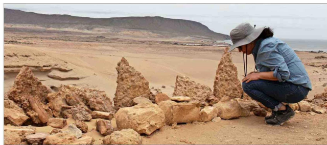
En el Parque Paleontológico Los Dedos, los visitantes pueden recorrer los senderos y encontrar evidencia fósil de los animales que ahí vivieron.