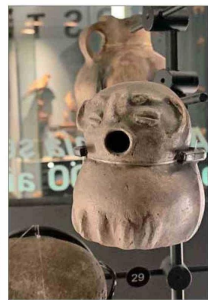
Figura antropomorfa de la cultura Pitrén que se puede ver en el Museo de Historia Natural de Concepción.