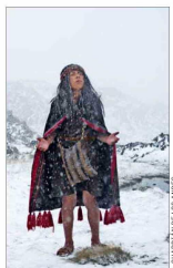
El documental recrea los meses previos a la muerte del niño.