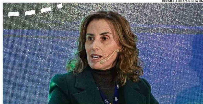
RODRIGO FUICA/AGENCIA UNO