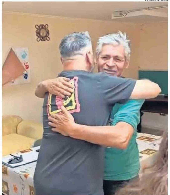
EL MOMENTO EN QUE ESTOS DOS HERMANOS SE FUNDEN EN UN ABRAZO FRATERNAL DESPUÉS DE AÑOS SEPARADOS.