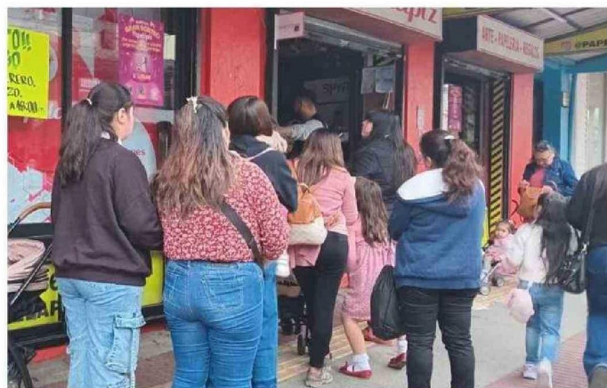
PARTE DEL COMERCIO CERRÓ, MIENTRAS USUARIOS ESPERABAN QUE EL SERVICIO VOLVIERA A LA NORMALIDAD.

Ante la magnitud del evento, se activó un Cogrid regional a las 16:00 horas en la capital regional para coordinar las res-