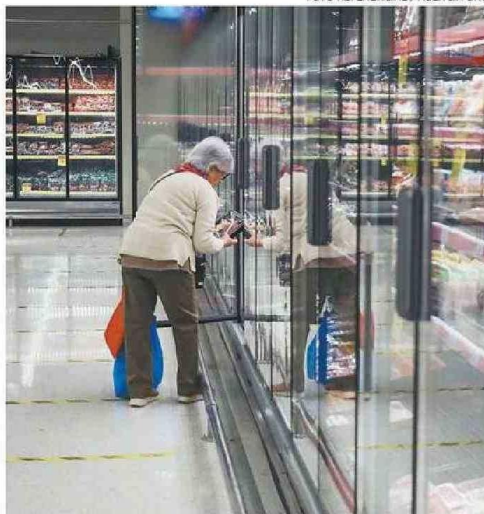
MIENTRA EL PIB REGIONAL BAJÓ EL CONSUMO DE LOS HOGARES SUBIÓ.

“Atacama depende del cobre mucho más que el promedio del país, es la región clave que depende del cobre, mucho más que las otras regiones de Chile y eso hace que tengamos estos ciclos muy volátiles de alzas muy grandes o disminuciones muy grandes, como en este caso”, cerró el econo-