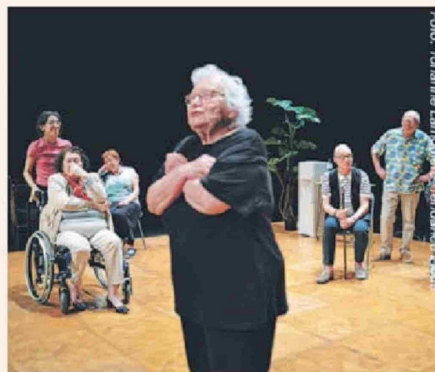
La vida secreta de los viejos.