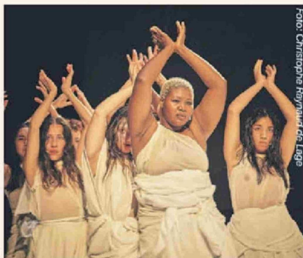
Sea of silence.