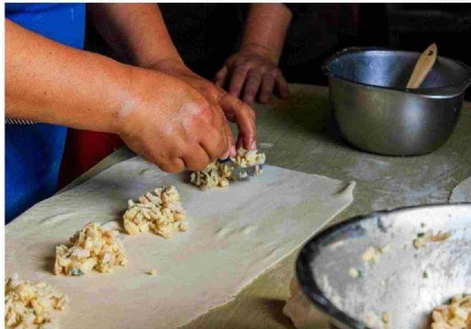
EL PROGRAMA ENTREGA CAPACITACIÓN, ASISTENCIA TÉCNICA Y RECURSOS PARA CONSOLIDAR EMPRENDIMIENTO.

En la etapa Avanza, el programa beneficiará a 15 mujeres de la región, quienes junto al acompañamiento técnico accederán a un fondo individual de hasta $2 millones, mientras que otras siete seleccionadas en la etapa Consolida, recibirán, además de una asistencia técnica, hasta $3.500.000 para consolidar la formalización de sus negocios.