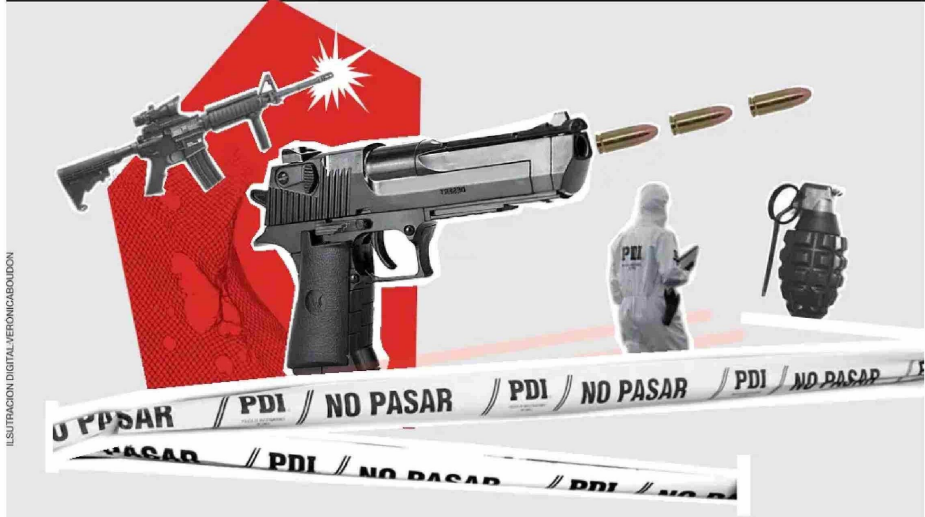
ILUSTRACION DIGITAL MERUONICABOURDON