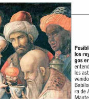
Posiblemente los reyes magos eran sabios entendidos en los astros, venidos de Babilonia. Pintura de Andrea Mantegna.