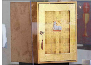
La creadora Soledad Chadwick recurrió al dorado, que simboliza los atributos divinos y también a la figura del cordero pascual.