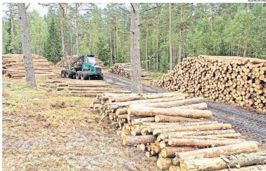
INDUSTRIA MADERERA Y DE LA CELULOSA TENDRÍA BUENOS RESULTADOS.

diciones económicas globales mejoren y se mantenga una política monetaria prudente por parte del Banco Central, la diversificación de productos y sectores económicos puede mitigar algunos efectos inflacionarios.