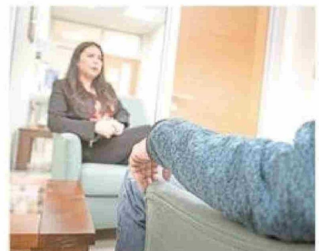
El proyecto incluyó mediciones en el ámbito psicológico.

De cara al futuro, el Cadi-Umag proyecta expandir su trabajo en el estudio del Long Covid, fortaleciendo redes internacionales de colaboración y compartiendo datos con bases globales. Actualmente, una de sus investigaciones está en proceso de publicación en una revista internacional, consolidando el rol del centro como referente en la investigación de las secuelas del Covid-19.