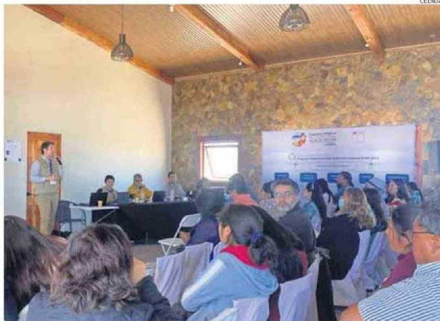
LA REUNIÓN, DEL PROCESO DE CONSULTA INDÍGENA, DESARROLLADA ESTE MARTES EN EL POBLADO DE CAMAR.

De todas maneras, se supo que las reuniones hasta ayer, más allá del detalle de la discusión que por supuesto fue amplia en temas a tratar, se dio desde una visión bastante unitaria de las comunidades, más allá de las posición que tiene cada una de las comunidades, respecto de la Estrategia Nacional del Litio y el acuerdo entre Codelco y SQM, por sus distintos grados de afectación.