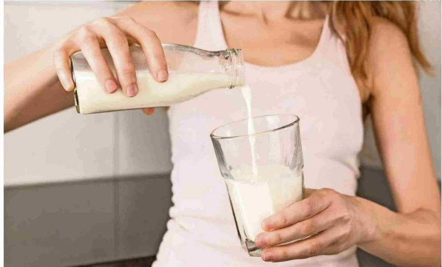
Uno de los valores nutricionales del consumo de leche es el aporte de calcio al organismo.

"Hoy día nos encontramos con algunas alergias o intolerancias, por lo cual la industria ha tenido que ir adaptando sus productos. Es así como la leche sin lactosa ya es bastante masiva y conocida, mientras que también están disponibles en el mercado la leche de burra, o de cabra, para otro tipo de consumidores con intolerancias o alergias alimentarias. En este caso, la leche A2 previene malestares estomacales. Se trata de una leche natural que no lleva ningún tipo de producto adicional añadido y tiene los mismos porcentajes de calcio y de grasa", precisó Subiabre.