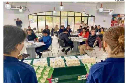
Una veintena de personas probaron la leche y sus efectos.

“Realizamos esta investigación, para poder entregar al consumidor pruebas reales de cuál leche es mejor según la enfermedad que tenga”