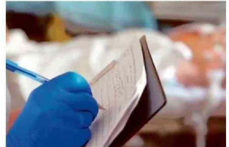
EL SISTEMA ESI CATEGORIZA LA GRAVEDAD DE LOS CASOS DE 1 A 5.

Con estos antecedentes preguntamos en la Dirección del hospital, desde