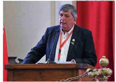
EL LÍDER DEL PC, LAUTARO CARMONA, EN EL SEGUNDO DÍA DE REUNIÓN.