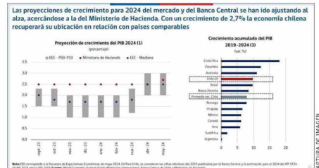
Las proyecciones de crecimiento para 2024 del mercado y del Banco Central se han ido ajustando al alza, acercándose a la del Ministerio de Hacienda. Con un crecimiento de 2,7% la economía chilena recuperará su ubicación en relación con países comparables

frente al crecimiento del PIB, en línea con su objetivo de control de la inflación, dada la importancia de la brecha del PIB como variable relevante en la decisión de la TPM (Tasa de Política Monetaria)". "Es cierto que la política fiscal se guía a partir de la regla del balance cíclicamente ajustado, el