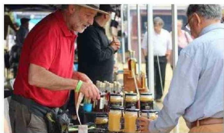
DESDE HACE AÑOS SE PUEDE ADQUIRIR EN LAS MUESTRAS DE CHONCHI PRODUCTOS COMO MIEL, LICORES Y CERVEZA DE BARRIL.

A dos semanas de la gran Fiesta Criolla, el Parque Municipal Notuco acogió la decimonovena versión de la Expo Bosque, iniciativa organizada por la Agrupación de Productores Locales El Canelo, la Corporación Nacional Forestal (Conaf) y la Municipalidad de Chonchi. ☺