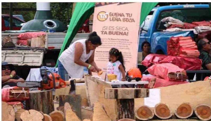
LA LEÑA SECA, UN COMBUSTIBLE QUE AÚN MUCHOS NO UTILIZAN EN LA ZONA, FUE PARTE DE LA MUESTRA IMPULSADA POR ALIANZA ENTRE EL SECTOR PÚBLICO Y EL PRIVADO.