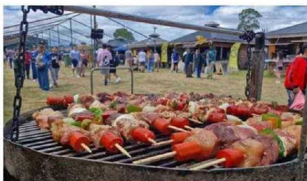
LOS TÍPICOS ANTICUCHOS CHILOTES SE COCINARON AL PASO DE LOS CHILOTES Y TURISTAS.