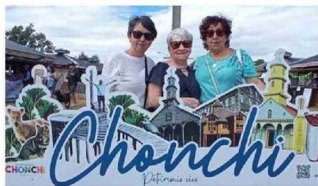
JUNTO ESTE HERMOSO CARTEL DE ATRACTIVOS CHONCHINOS SE FOTOGRAFIARON ASISTENTES A LA CITA DEL FIN DE SEMANA.