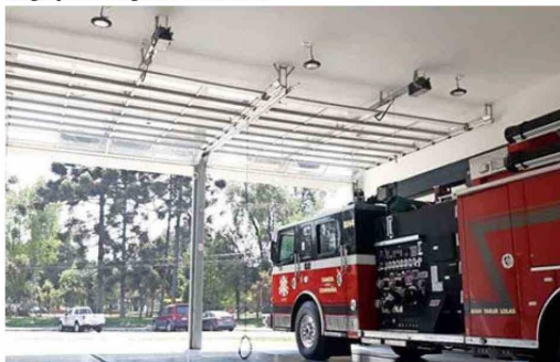
Portones seccionales en compañía de bomberos.

Importaciones Aeropuerto Internacional AMB, TECK Quebrada Blanca Fase 2, Minera El Abra, Mantoverde, Codelco, Concha y Toro, Viña Undurraga, los data centers Google 1, Google 2 y Amazon (en construcción), entre muchos otros.