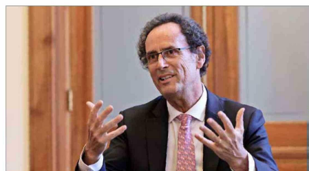
Es profesor titular en el Depto. de Ing. Estructural y Geotécnica e investigador del Centro para la Gestión del Riesgo de Desastres (Cigiden).

que viene, declaró que “este es un período extraordinariamente desafiante para la universidad porque es extraordinariamente desafiante para Chile. En este momento se están jugando valores fundamentales de la sociedad chilena que tienen que