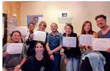
UNO DE LOS TALLERES DE CAFÉ IMPARTIDOS EN LA CAFETERÍA.

so de su casa. “Compré mi primera cafetera (de cápsula) en un cyberday, y empecé a probar porque yo no tenía idea del mundo del café porque yo venía del mundo del vino, pero me gustaba el café” asevera.