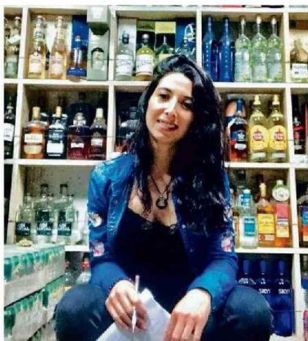
TRABAJANDO EN LA DISTRIBUIDORA DE SU PAPÁ EL 2019.