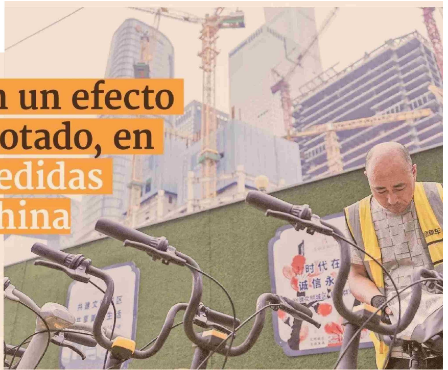
POR C. VERGARA, B. PESCIO Y C. LEÓN

Buenas noticias, aunque no del todo determinantes a juicio de algunos analistas, recibió la economía chilena desde China.