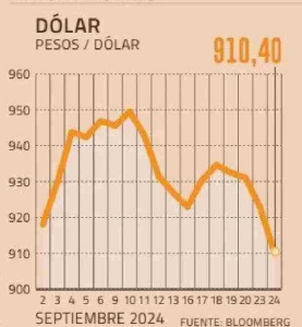
EL ÚLTIMO MES

algún tipo de acción (en China) y esto es bastante agresivo”.