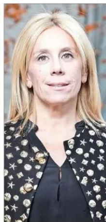
PIA GREENE JEFEA DE LA DIVISIÓN DE SEGURIDAD PÚBLICA DEL MINISTERIO DEL INTERIOR

“No es muy difícil prever que tendrán mayor temor al caminar por su barrio si la tasa de homicidios se disparó; ya no basta con no oponer resistencia”.