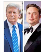
Trump lanza duros reproches a Biden y Harris en entrevista con Elon Musk. | A 5

Las finanzas personales de los candidatos a vicepresidente Tim Walz y JD Vance no podrían ser más diferentes. | B 5