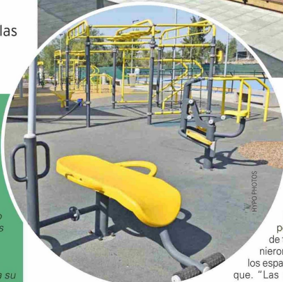
EL LUGAR ES PARTE DE LAS OBRAS de compensación de la nueva conexión entre Autopista Vespucio Norte y Ruta 68.

entorno urbano que mejore la calidad de vida de quienes viven cerca de la conexión entre las autopistas Vespucio Norte y Ruta 68”, detallan desde la Dirección General de Concesiones del MOP.