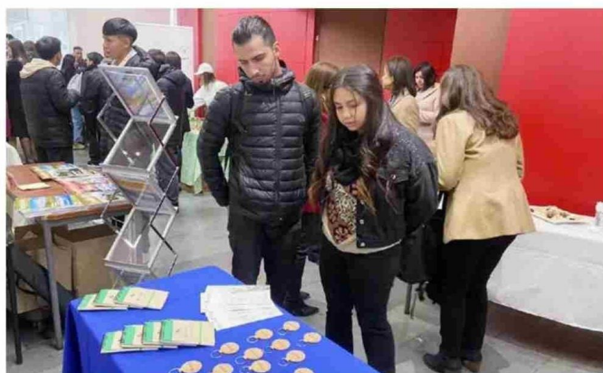
Hidronor entregó información sobre su gestión integral de residuos y también algunos regalos.

una necesidad de las empresas por cumplir una regulación que no saben cómo va a salir y qué metas va a exigir”.