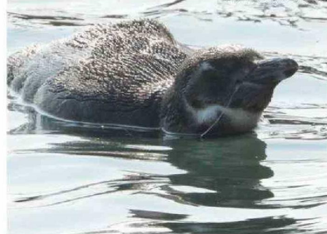
PINGÜINO CON HILO DE PESCAR ENREDADO.

-Además de la pesca recreativa, está la pesca de arrastre y los desechos de esta misma. A esto se le suman los ataques de perros que han sufrido especies como chungungos, lobos marinos y aves. También la extracción ilegal de guano genera un impacto negativo en todo el ciclo de vida de la avifauna marina, ya que, en islotes cubiertos por guano, ellas realizan sus