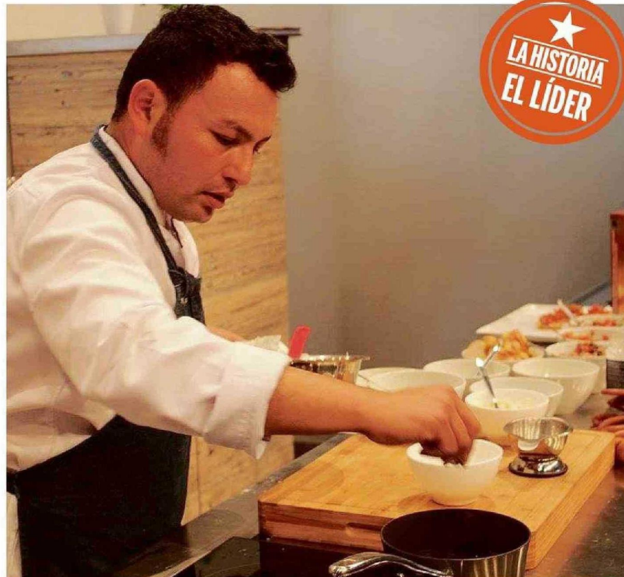
RECUERDO DE LA BECA EN EL INSTITUTE CULINARY DE NEW YORK AÑO 2009.