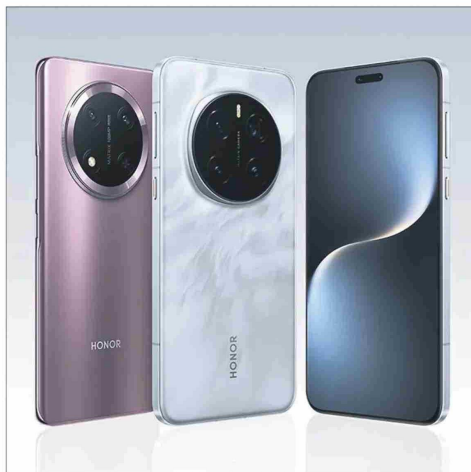
El Magic7 Lite cuesta desde $399.900 la versión de 256 GB.

Para el profesor Paredes, este modelo pasa su prueba de evaluación. "Es un teléfono de gama media con algunas prestaciones de gama alta. Es un aparato bonito, elegante y robusto. Tiene una pantalla relativamente grande de 6,78 pulgadas con resolución similar a la del iPhone Pro Max -2.700 por 1.224 píxeles-, lo que permite un alto grado de detalles. Su procesador de ocho núcleos permite ejecutar aplicaciones con bastante fluidez, y las cámaras traseras y delanteras son mucho mejores que lo que un usuario medio suele requerir", resume.