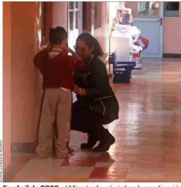
En abril de 2022, el Mineduc lanzó el plan de reactivación educativa...