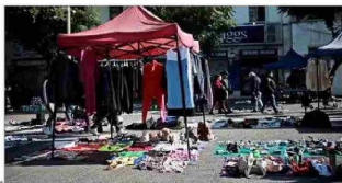
DERRUIDOS.— Sectores de la capital como Meiggs o la Vega Central se han deteriorado de la mano de la actividad informal.

Con distintos tipos de medidas, que van desde equipos de fiscalización hasta el aumento de permisos municipales, algunas autoridades han buscado enfrentar el fenómeno del comercio ambulante, que prolifera en barrios comerciales de las distintas ciudades.