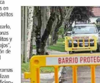
Las medidas de seguridad deben involucrar un esfuerzo mancomunado entre diversas instituciones, plantean especialistas.

Añade que "luego la estrategia debe considerar incentivos económicos para las familias y municipios para la reinserción escolar de jóvenes desahuciados, instalación de 'oficinas de oportunidades laborales' de cooperación público-privada para dar trabajos lícitos a jóvenes y adultos".