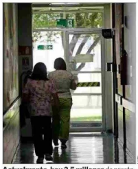
Actualmente, hay 2,5 millones de prestaciones atrasadas.

Otra propuesta, indica Sánchez, es "flexibilizar en forma inteligente la gestión médica para incentivar el trabajo fuera de horarios normales, sujeto a normas e incentivos claros y bien gestionados y supervisados para evitar el abuso", y "resignar más recursos a establecimientos que claramente lo requieren, pero amarrados a cumplimiento de indicadores y metas, sancionando el incumplimiento".