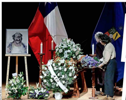
Durante la tarde de ayer, el escritor fue velado en el Teatro Nacional Chileno en una ceremonia organizada por la Universidad de Chile, que dio a conocer la noticia de su muerte.

"Gracias, maestro, por la vida vivida. Por los cuentos, las novelas y el teatro. Por el compromiso político. Por "El show de los libros" que amplió las fronteras de la literatura. Por soñar que la nieve ardía en el Chile que te dejó tanto", declaró ayer en su cuenta de X el Presidente Gabriel Boric al conocerse la muerte del escritor, a los 83 años. Atestado por un cáncer al estómago en 2016, en los últimos años Skármeta llevaba una vida retirada; había publicado su último libro en 2015, "Libertad de movimiento". Pero no había dejado de estar presente, como lo demostró la gran cantidad de mensajes en redes sociales de la comunidad literaria y en el velorio que