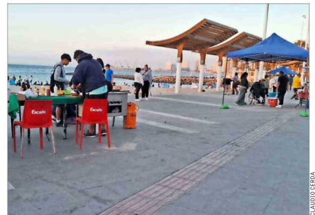
ANTOFAGASTA. —Comerciantes ambulantes instalan parrillas en las tardes en el balneario municipal de Antofagasta.

Cada tarde en el balneario municipal de Antofagasta comienzan a instalarse ambulantes, sobre todo dedicados a la venta de comida preparada en parrillas o cocinillas que humean sus preparaciones. Una esce-