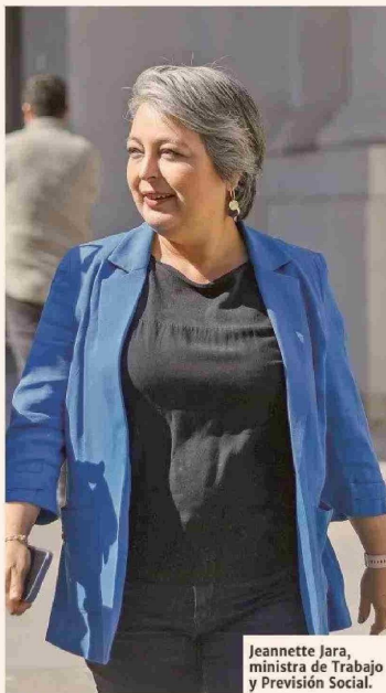
Jeannette Jara, ministra de Trabajo y Previsión Social.