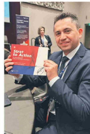
© Patricio Pino , jefe de Mejora Continua Complejo Viñales.