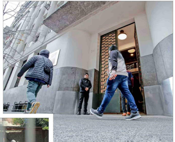
DILIGENCIAS. — En el marco de la indagatoria que dirige la fiscalía, se pidió al Minsal la entrega de la nómina de personas electrodependientes fallecidas.

Alarma. Las alarmas de un banco de Cerrillos no se habrían encendido debido al corte de luz.