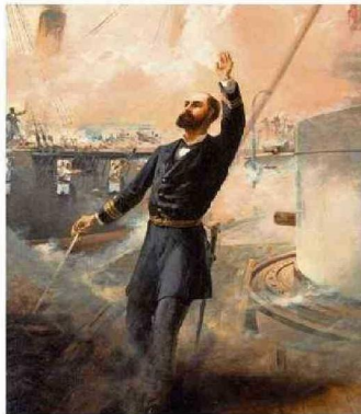
MUERTE DE ARTURO PRAT EN LA CUBIERTA DEL HUÁSCAR, THOMAS SOMERSCALES (1880).

Navegamos por los distintos afluentes que permean las artes, la música y las humanidades. Podemos evidenciar el protagonismo indiscutido del litoral en cada letra y trazo.