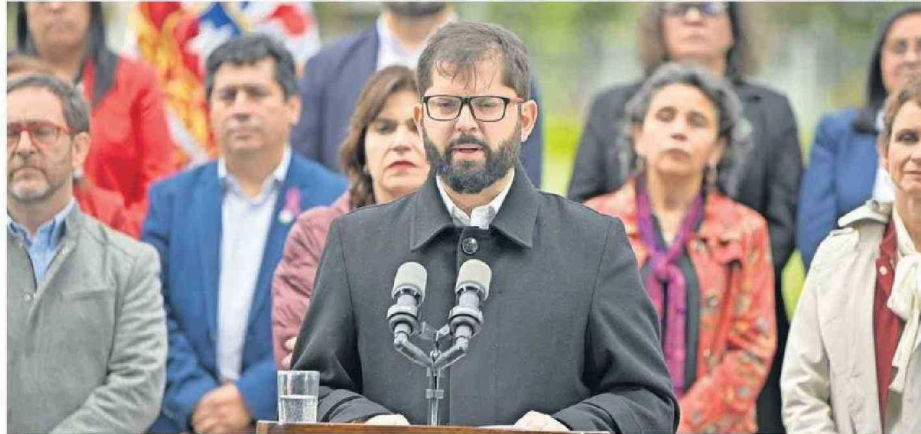
LA PRIMERA VISITA DEL PRESIDENTE BORIC A TEMUCO FUE EL 10 DE NOVIEMBRE DEL 2022. AHORA NO TIENE EN AGENDA REUNIRSE CON EMPRESARIOS.

Ya a pesar que no se entregaron más detalles de la agenda del Mandatario, se ha especulado con la posibilidad de que visite los hospitales de Manquehue y Villarrica, aunque sólo el se-