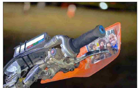
Como siempre una foto de la familia acompañándolo en esta carrera muy extensa.