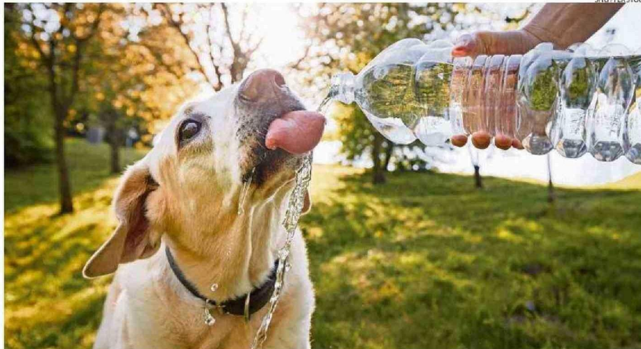
Cuando los termómetros marcan altas temperaturas, los canes suelen aumentar el consumo de agua.

Cuando las temperaturas aumentan considerablemente, los animales de compañía están expuestos a un mayor riesgo de deshidratación. Para prevenir esta condición, el consumo de agua es clave.