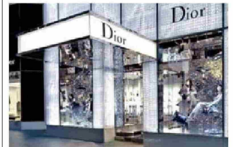
THE WALL STREET JOURNAL.