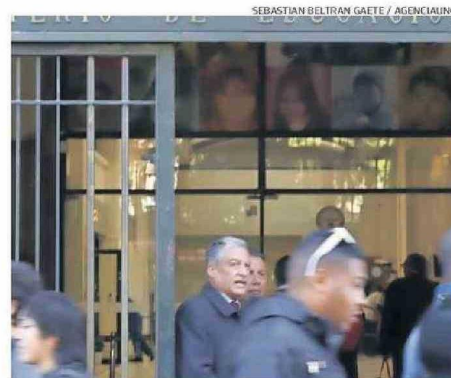
SE DESCARTÓ LA PÉRDIDA DE INFORMACIÓN SOBRE LA PAES.