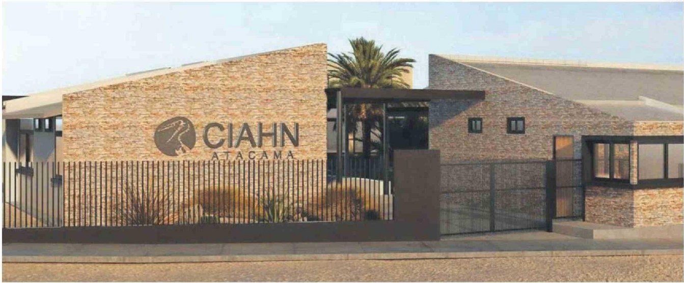
CENTRO DE INVESTIGACIÓN CIAHN ATACAMA EN UNA MAQUETA.