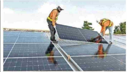
Crece generación regional de energía fotovoltaica En los dos últimos años la presencia de parques solares aumentó en 120%. De los 576 en el país, 79 son locales. PÁG. 11