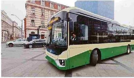
Electromovilidad: sus avances y desafíos en la zona 44 buses eléctricos debutan en Valparaíso en septiembre, sumándose a un proceso lento, pero sostenido. PÁG. 4