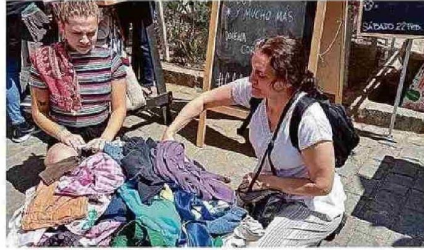
El reciclaje de ropa que dejó un megaincendio Siniestro porteño de 2014 llevó a la creación de "Huila", iniciativa que enseña y fomenta la reutilización textil. PÁG. 12