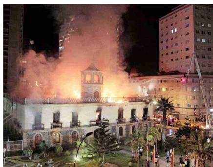
LLAMAS.— A las 22 horas del jueves 26 de febrero del 2015 comenzó el siniestro, que Bomberos logró controlar recién pasada la 1 de la madrugada.

por la autoridad regional, el proyecto que pretende devolver la vida al edificio patrimonial está siendo trabajado por equipos técnicos y contempla la inversión de $9.900 millones.