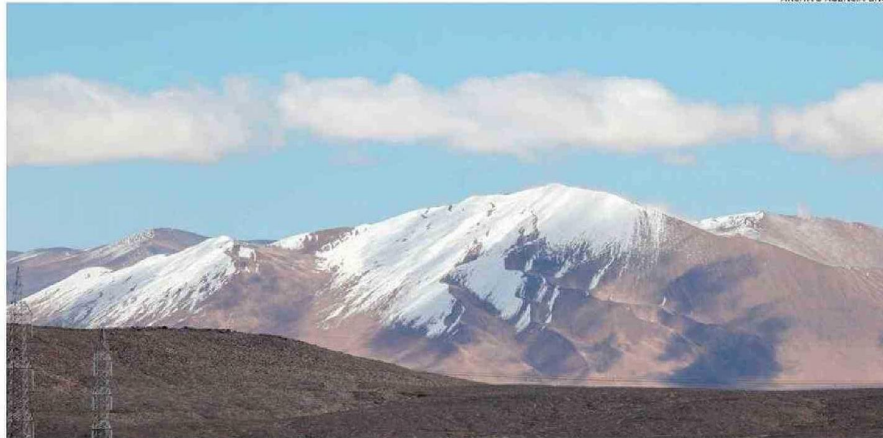
LA MUOGRAFÍA PERMITIRÍA MEJORES PROSPECCIONES MINERAS EN LA REGIÓN Y DESDE LA UDA BUSCAN AVANZAR EN SU DESARROLLO.

Así, a partir de un flujo conocido de muones se mide la atenuación del flujo, de allí se calcula la opacidad del material al paso de los muones y entonces puede inferirse la densidad media del material a lo largo de la trayectoria del muón. Disponiendo de un dispositivo que permita medir el flujo de muones proveniente de distintos sectores del objeto en estudio, es posible inferir la existencia de distintas estructuras internas a partir de los cambios