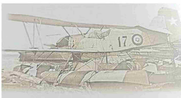
Avión Curtiss Falcon N° 17, con el cual la Fuerza Aérea de Chile inició sus actividades en Magallanes.

Al mismo tiempo, se establecieron los grados de equivalencia en los demás escalafones para asemejarlos con los de guerra. Un ingeniero jefe o un intendente jefe en el ítem de ingenieros o de administración, equivalía al grado de comandante de grupo. En el caso del escalafón de sanidad, se fijó como grado máximo el de cirujano mayor, equivalente al de comandante de escuadrilla.