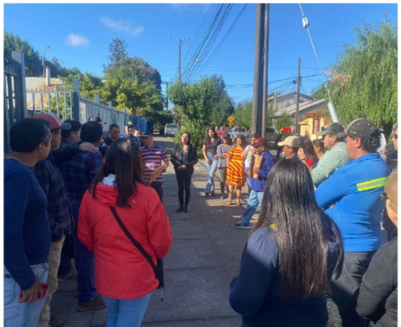
EN EL FRONTIS DE LA EMPRESA Frontel se reunieron los vecinos para reclamar por los permanentes cortes de energía eléctrica.

El problema también afecta a la salud de los habitantes, especialmente de los adultos mayores, quienes representan cerca del 60% de la población en estas zonas. Muchos de ellos dependen de la refrigeración para conservar medicamentos como la insulina. "Cuando