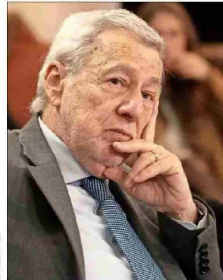
El canciller Alberto Van Klaveren se pronunció anoche sobre la polémica.